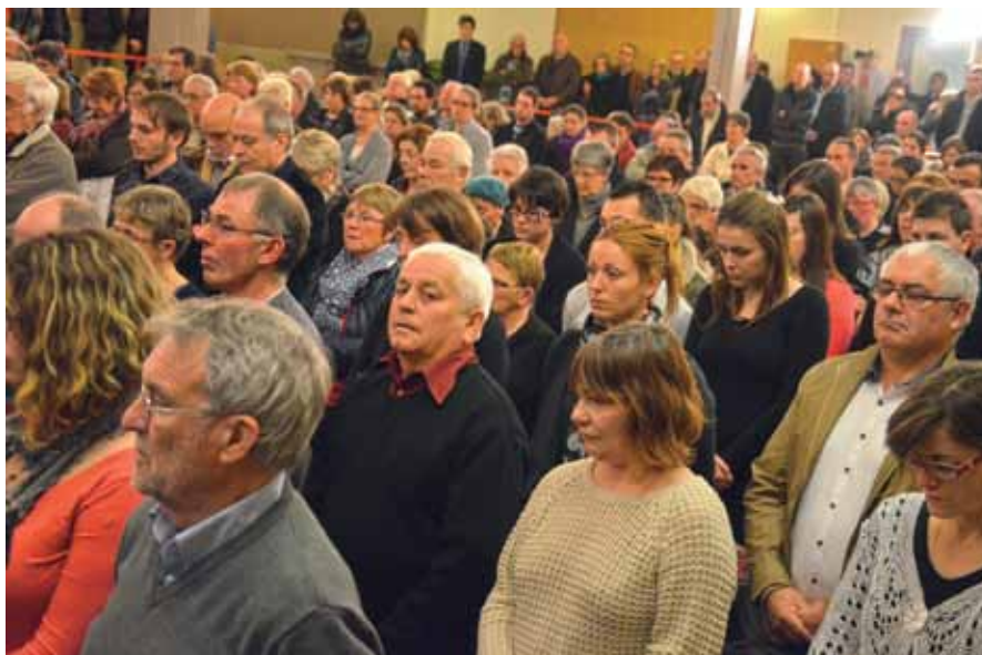
Une minute de silence en hommage aux victimes de l'attentat de Charlie Hebdo.