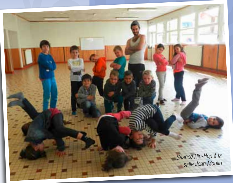
Séance Hip-Hop à la salle Jean Moulin

Cette année de nouvelles activités sont proposées aux enfants comme le Hip hop (avec l'ASPTT de Lannion), le jardinage sous forme d'ateliers ludiques, la découverte des Arts du cirque, l'Aïkido, le Volley-ball, marionnettes et théâtre d'ombre (avec la Compagnie du Grimoire de Gurunhuel).