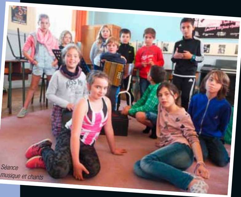
Séance musique et chants

En distro-skol 2014 e oa bet staliet, en hon skolioù publik e Bear, ar mareoù obererezhioù troskol (TAP) evel ma oa goulennet gant Ministrerezh an Deskadurezh-Stad, da-geñver an implij-amzer nevez er skolioù.