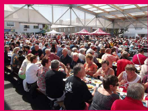
Fêtes de Begard