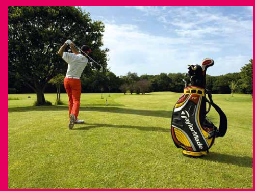
Le Golf de Begard