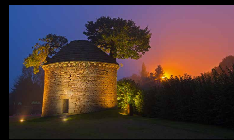
Le colombier d'Armoripark