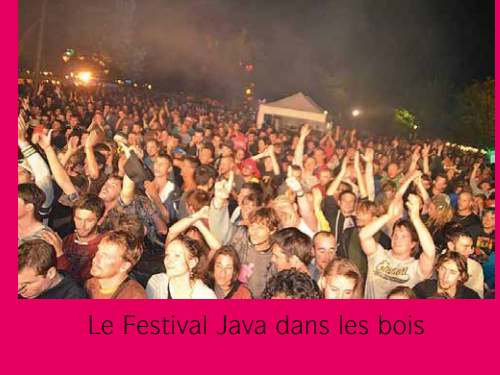
Le Festival Java dans les bois