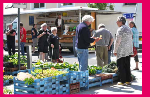
Vendredi Jour du Marché