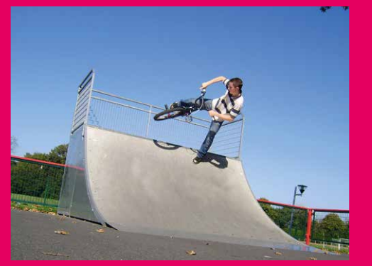
Le Skate Park