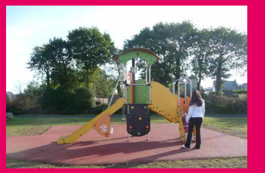
Aire de jeux Rue Anatole France