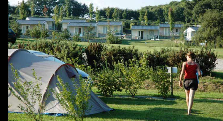
Le camping du Donant