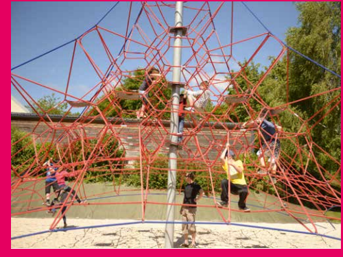
Armoripark : La Pyramide de corde