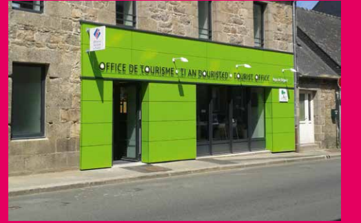
Office de Tourisme