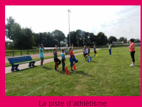
La piste d'athlétisme