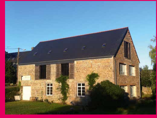
La Tannerie : espace culturel d'Art contemporain