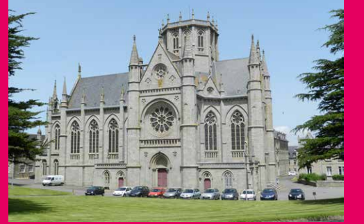
Abbaye du Bon Sauveur