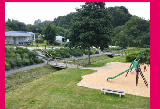
Le Camping du Donant