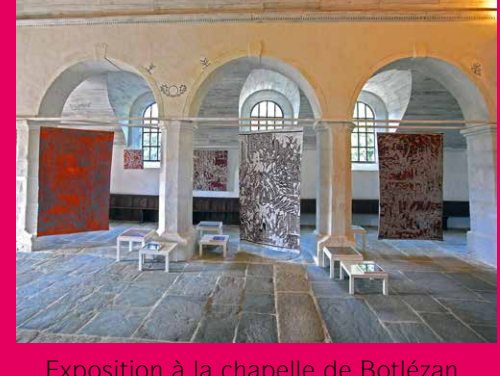
Exposition à la chapelle de Botlezan